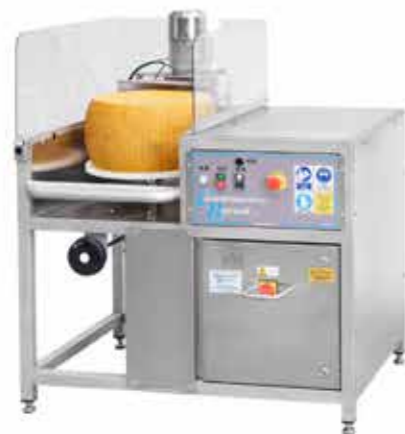
ROCK13 TAVOLO SEZIONATORE A "ROCCIA"