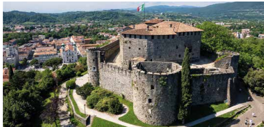
Dall'alto, scorci di Gorizia: via Rastello, la fontana di Nettuno, il castello e il fiume Isonzo

Da qui è stata adottata da tutta la Mitteleuropa nel senso più ampio del termine, dalla Romania e Bulgaria dove viene chiamata kosonac, all'Austria, alla Boemia, alla Polonia con la Babka. Presente anche nei ricettari ebraici askenaziti dell'Europa orientale, grazie a emigranti ha raggiunto perfino gli Stati Uniti dove è documentata a Kansas city. La cultura contadina sulla quale si sono innestati e contaminati questi apporti allogenici ha però lasciato molti retaggi nella gastronomia di ogni giorno, a cominciare dalle numerose minestre di verdure o delle famose frittate di erbe, alte e soffici. Da non dimenticare però la rara e deliziosa "rosa di Gorizia": un radicchio delicato e speciale