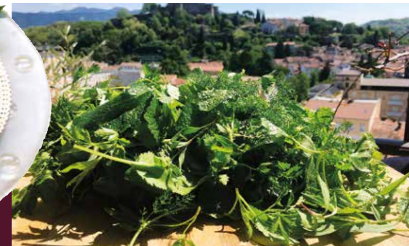
Specialità del territorio: a lato lo Strucolo in straza con ricotta, il Presnitz o Gubana goriziana, erba per frittata. Nella pagina accanto il Liptauer Austrian Slovakian; sotto la tipica frittata verde