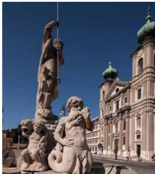
Dall'alto, scorci di Gorizia: via Rastello, la fontana di Nettuno, il castello e il fiume Isonzo