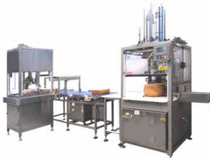
ROCK 23 ROCK 21