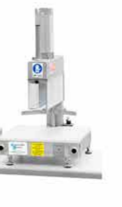
ROCK 18 PORZIONATRICE DA BANCO