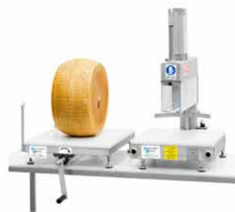
ROCK 19 SEZIONATRICE DA BANCO MANUALE