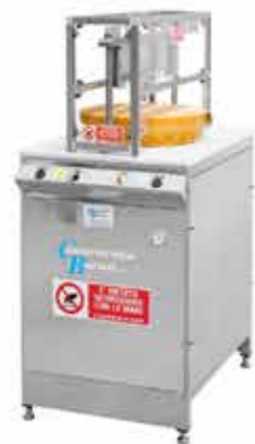
ROCK 20 PORZIONATRICE SEMI AUTOMATICA

PUO' TAGLIARE TUTTI I TIPI DI FORMAGGI A PASTA DURA E SEMIDURA, REALIZZANDO PEZZI A PESO SIA FISSO CHE VARIABILE