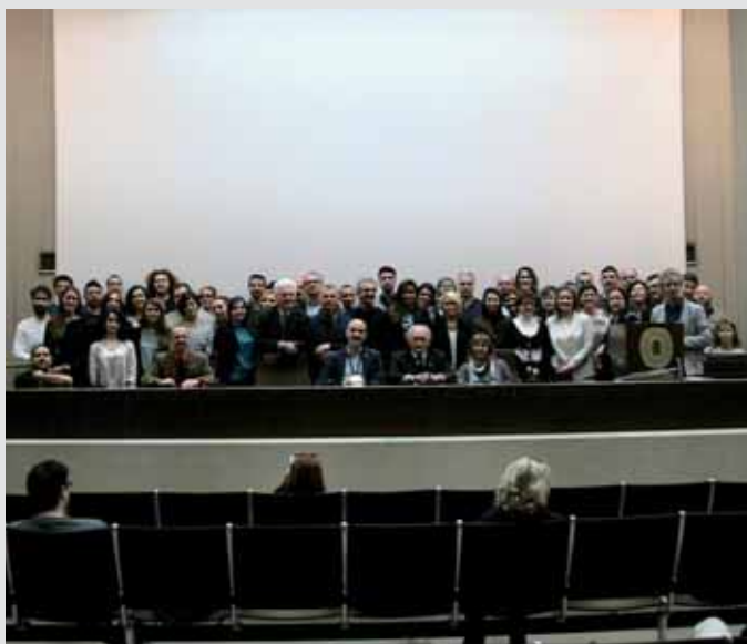
• Foto di gruppo all'investitura di Parma