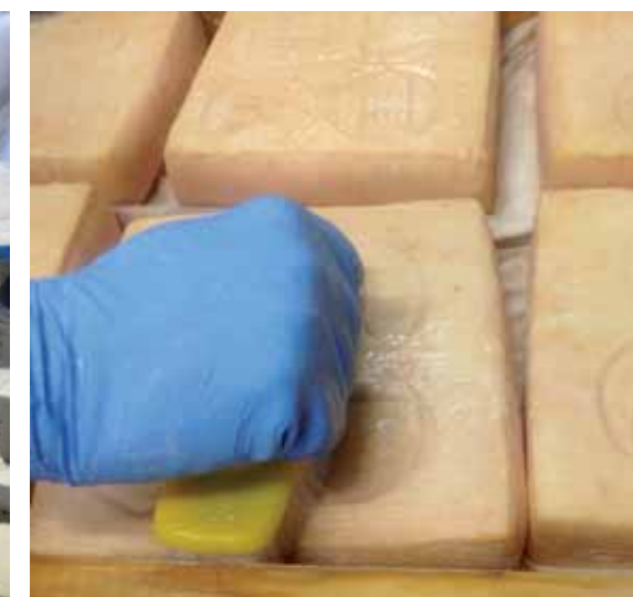
• Spugnatura delle forme

Nonostante un unico marchio consortile non tutti i formaggi sono uguali, ognuno possiede peculiarità che rispecchiano il latte utilizzato, i parametri tecnologici applicati e l'esperienza del casaro. Questa variabilità permette di accontentare le varie esigenze dei consumatori, che possono richiedere formaggi con struttura della pasta più cremosa o gestata con un' aureola attorno, con sapore più o meno dolce o acido, con aroma di burro o tartufo e con diverso grado di piccantezza. Il latte utilizzato per lo più di razza Frisona deve provenire da stalle