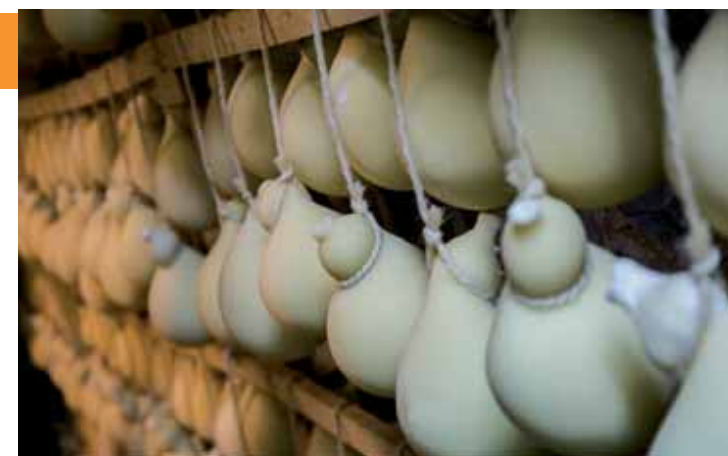
• Cacio cavallo di Agnone in stagionatura

Sulle montagne di Agnone piccole aziende agricole alimentano la produzione di formaggi tipici. L'esempio del caseificio di Franco Di Nucci