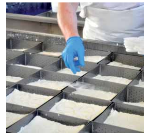
• Taleggio sui tavoli spersori

• Forma di taleggio con crosta tipica rosata