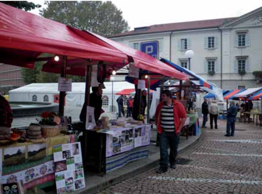
Sopra, il Crestumo Dop - Formaggio d'alpe ticinese Sotto, il mercato di Bellinzona