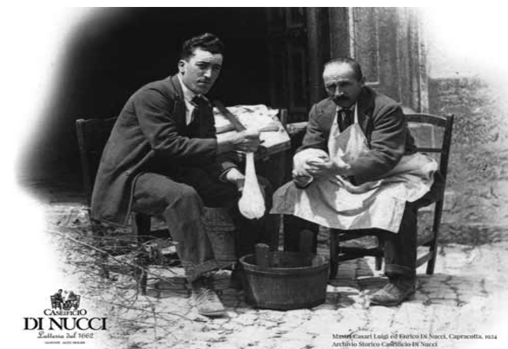
• Il sapere dei padri