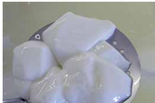
di Giuseppe Zeppa

L a fase più importante nella caseificazione è senza dubbio la coagulazione, ossia il passaggio allo stato solido di gran parte dei componenti presenti in un latte, che può avvenire essenzialmente mediante tre modalità: riscaldamento, acidificazione od azione enzimatica.