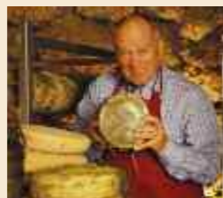
Carpeneo, storia d'amore e passione