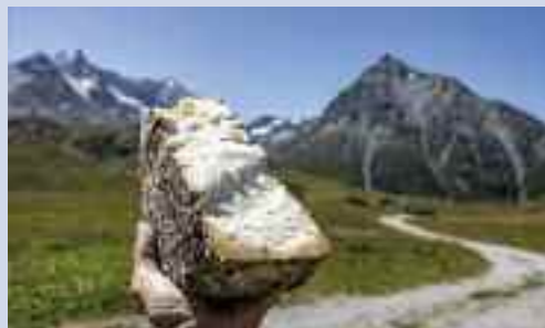
• Toma a latte acido di pecora