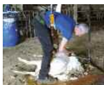
Tosatura ovina un rito in alta Langa