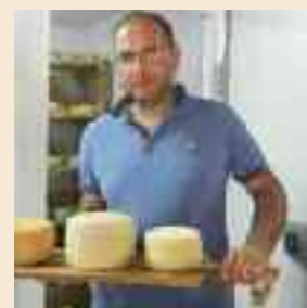
Pecorino Monte Poro giovanissima Dop