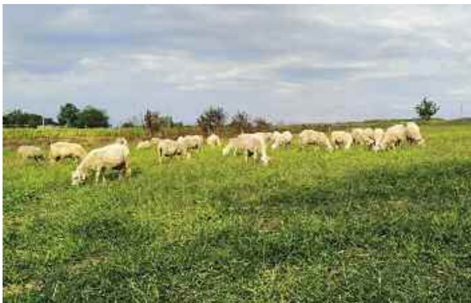
di Corrado Olocco

Riconosciuta il 7 luglio, è la più giovane Dop italiana, prodotta in Calabria con latte crudo di pecora sull'altipiano che si affaccia sul mare di Tropea. La nota località turistica fa parte dei 27 Comuni inclusi nel disciplinare. Tre le tipologie: fresco (da 20 a 60 giorni di stagionatura), semistagionato (da 60 giorni a 6 mesi) e stagionato (6-24 mesi).