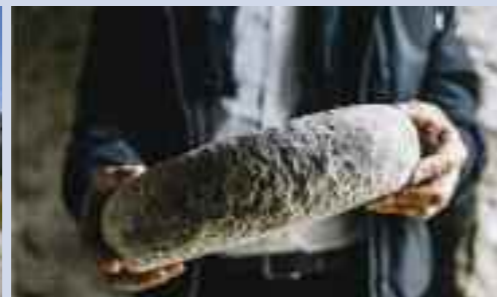
• La Toma Rusolina di vacca stagionata in alpeggio