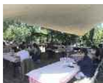
Lezioni all'aperto una felice avventura