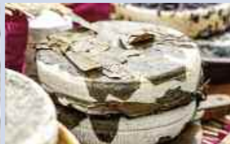
• Pecorini affinati in foglie di noce