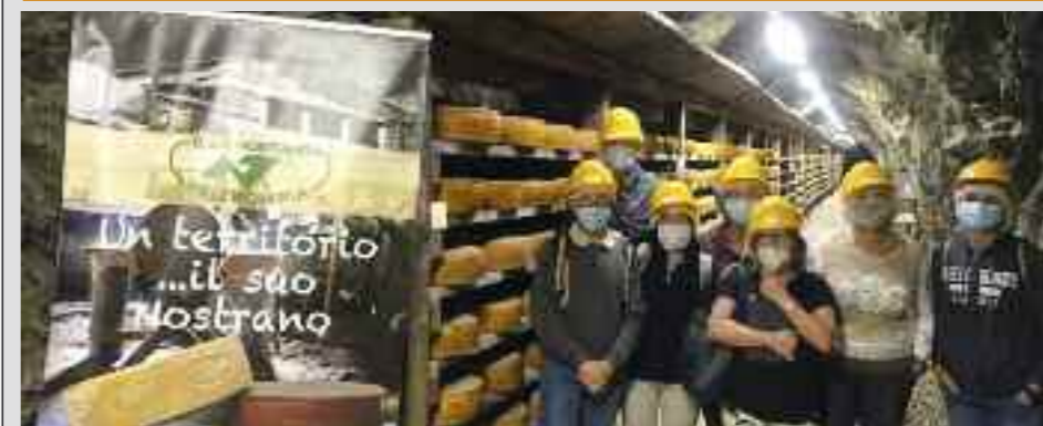
• La miniera di stagionatura del Nostrano Valtrompia