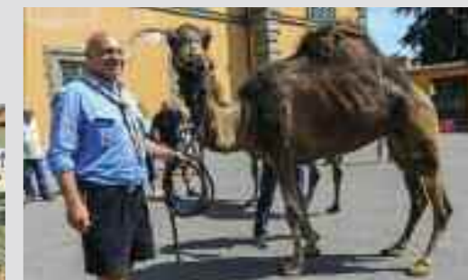
I dromedari di San Rossore in posa durante una visita degli scout. A lato, esemplari di pecore nere Massesi e la vasta tenuta oggi parco regionale

Nell'estate malinconica del virus, in un mondo mai visto così spaurito, ad aumentare lo scoramento una pessima notizia è rimbalzata da Pisa alle cronache. E' una vicenda di pecore nere e dromedari, che detta così sembrerebbe burlesca, ed è invece una pagina dolorosa - ne siamo convinti - per i lettori di InForma.